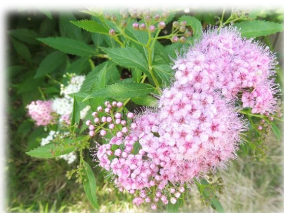
シモツケ(下野) 二題

意見・ご質問は、お気軽にお問い合わせください。 次号は6月30日に配信いたします。(石田久男)