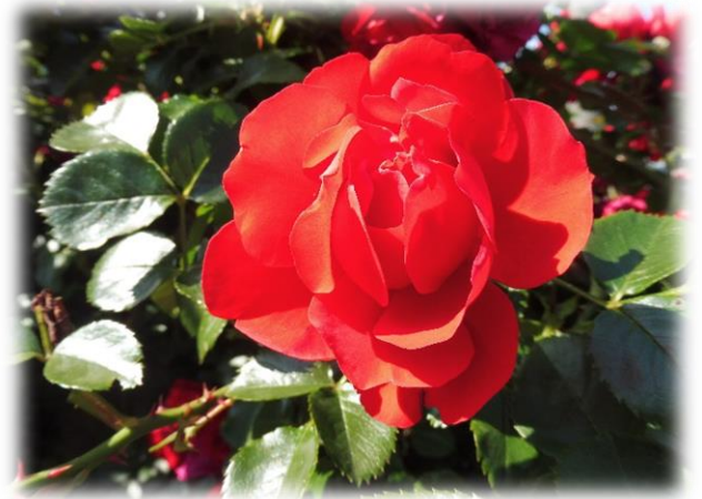
深紅の薔薇はいかが？

採用担当者らの就活セクハラ被害は社会問題化しており、各企業は社内啓発や面会時のルール作りなど、防止するための何らかの措置を講じることが必要です。本稿では、就活セクハラ問題の近況と、厚生労働省が実施する取り組みを概説します。